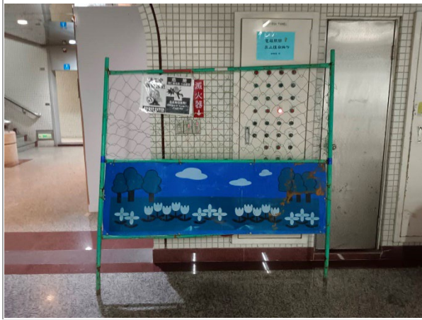
1. 文薈樓 2 部電梯更新中