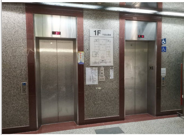
1. 文薈樓 2 部電梯更新前