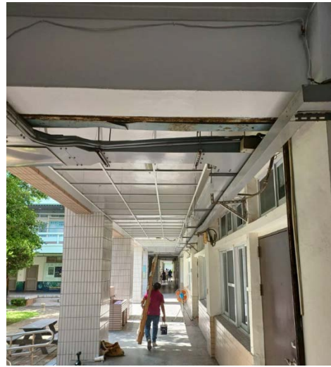
2. 原有天花板與燈具照明更新中