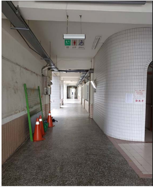
1. 整合布告欄系統施工中