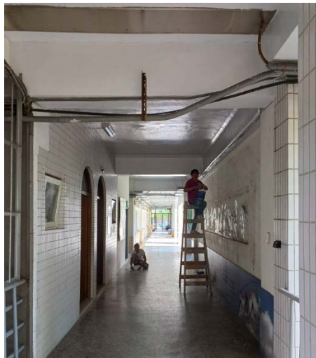
3. 原天花板、牆面面漆防水漆