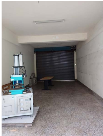
5. 原有地板須更新中