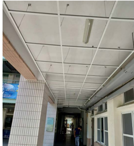
4. 天花瓣及燈具施作.安裝費