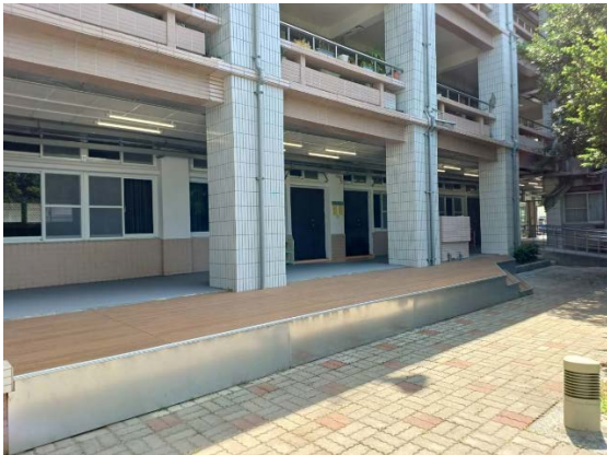
3. 戶外造型塑木架高地坪及熱浸鍍鋅金屬面板收邊