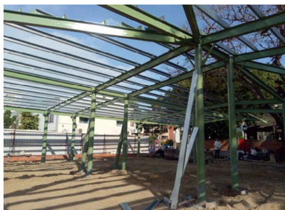
5. C 型鋼吊裝