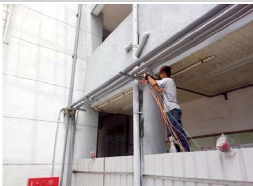
7. 消防受信總機配線