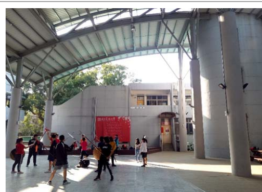
4. 新設磨石地磚及塑木地坪