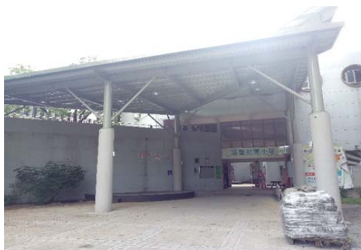
1. 活力轉角新設舞臺及屋頂