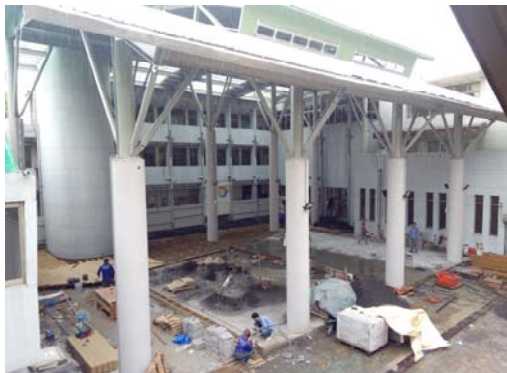
5. 塑木地板及磨石地磚施作