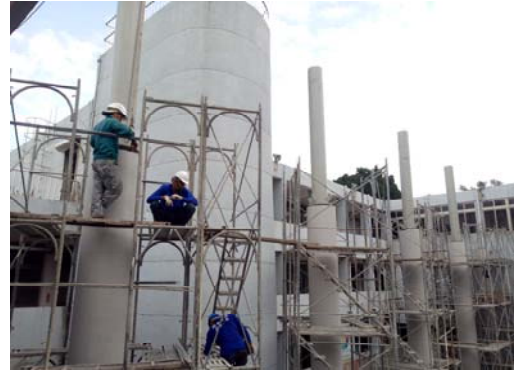
2. 墩柱噴塗及樑柱接頭安裝