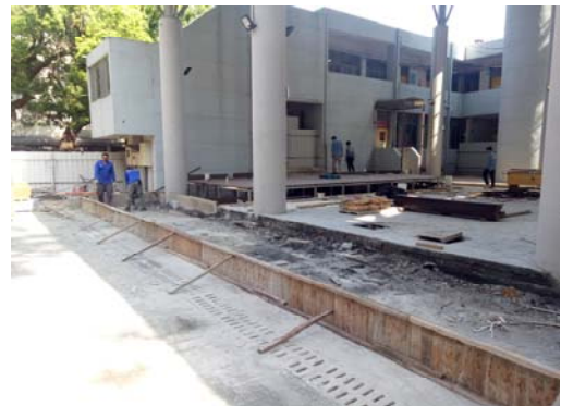
6. 舞臺及周邊坡道施作