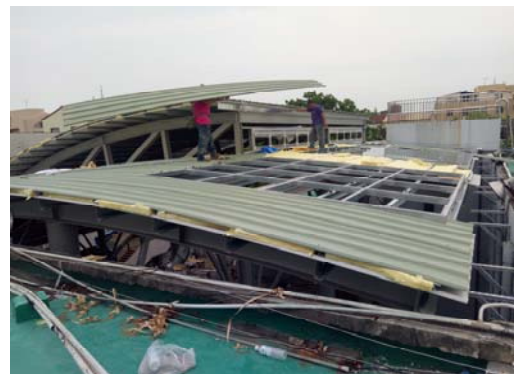
4. 屋頂隔熱岩棉及鋼板安裝