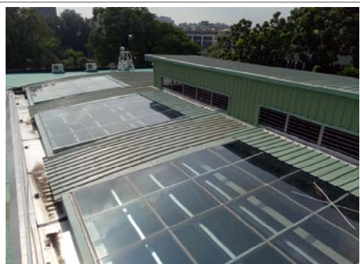
3. 新設 Low-E 玻璃增加採光