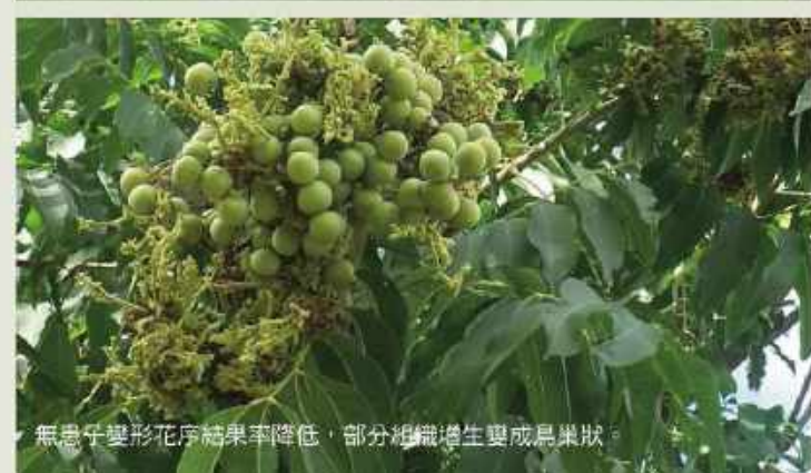
無患子變形花序結果率降低，部分組織增生變成鳥巢狀。