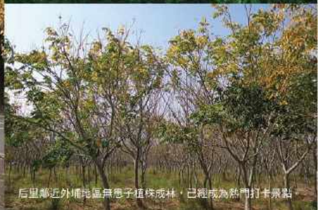
后里鄰近外埔地區無患子植株成林，已經成為熱門打卡景點。