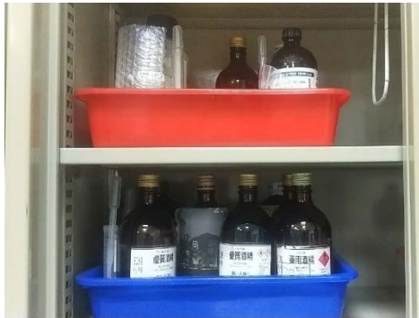
有機溶劑使用承接盤