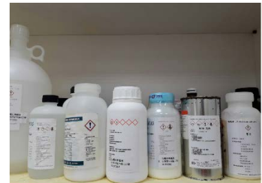
有機溶劑瓶身 GHS 標示